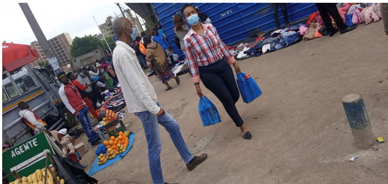
Figura 4: Venda nos passeios da Baixa da Cidade - foto do Autor, Baixa, Abril 2022.