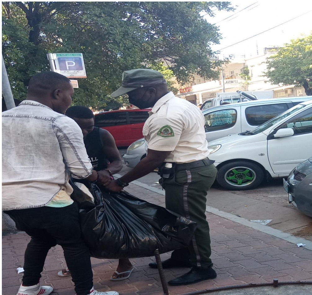
Figura 3: vendedores informais lutando e negociando com a Policia Municipal para recuperar a sua mercadoria, Baixa, Abril 2022.

As narrativas que ouvi e registei durante o período que durou a pesquisa etnográfica denotam uma certa complexidade caracterizada por divergências e convergências dentre os vendedores informais. Alguns vê a postura do Município com bons olhos, pese embora com certa frustração devido a inviabilização que traz para o seu negócio no âmbito da sua materialização. E outros olham como uma medida “personalista” engendrada pelo actual presidente do Conselho Municipal da Cidade de Maputo. Essa concepção é baseada na lógica que constroem em relação aos mandatos do actual edil Éneas Comiche com o anterior David Simango, facto que as manifestações e críticas