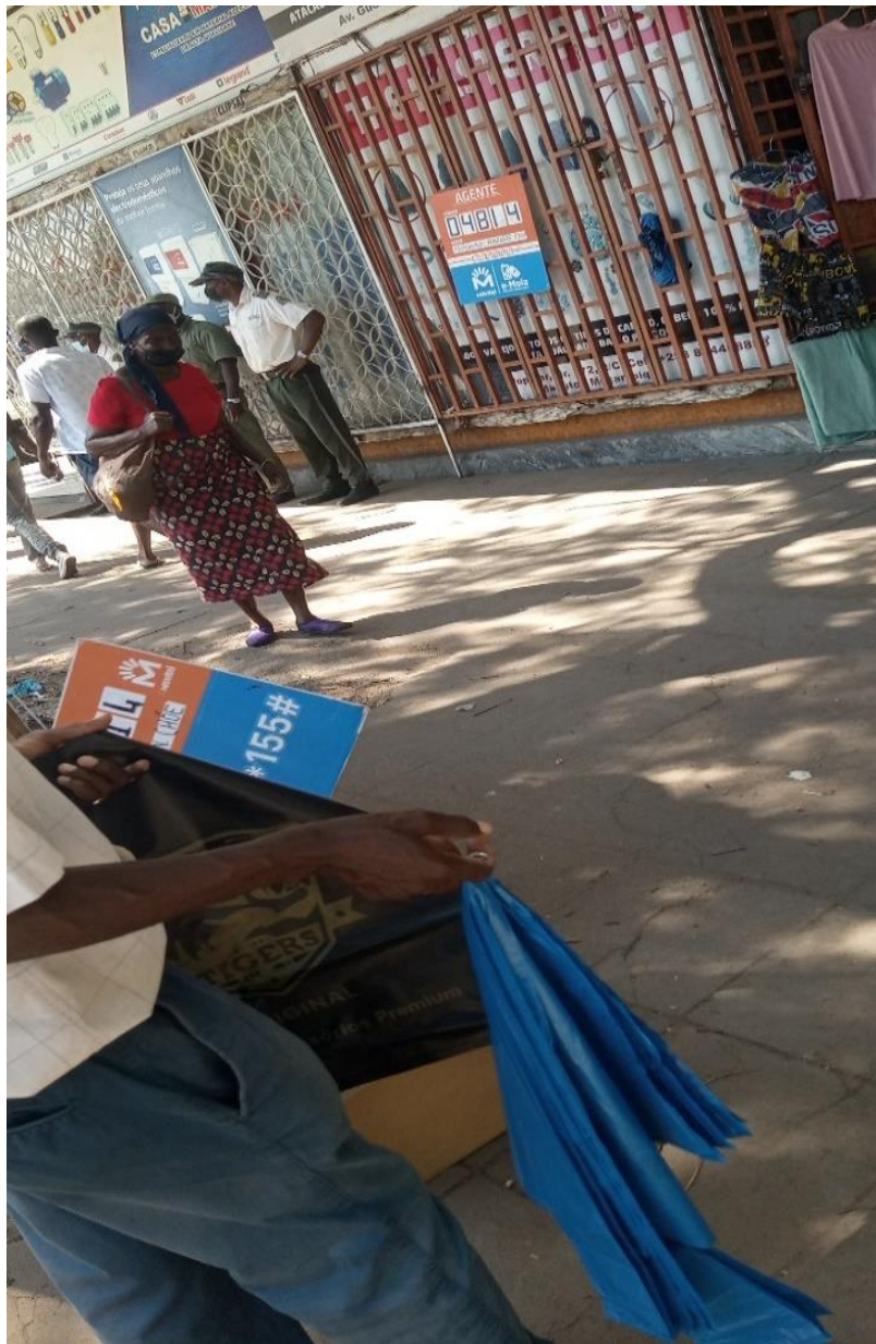
Figura 5: posicionamento da polícia antes da chegada dos vendedores na Av. Guerra popular- foto do Autor, Maio de 2022.